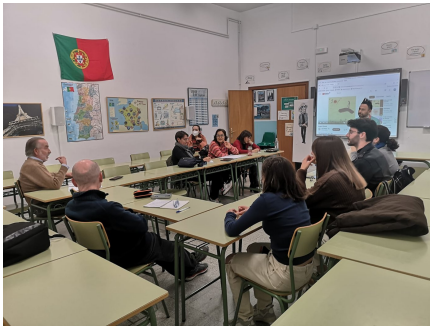
Los alumnos de la EOI de Almendralejo participando en una de las actividades organizadas con motivo del centenario del nacimiento de Saramago.

A lo largo de este curso, el Departamento de Portugués de la Escuela Oficial de Idiomas (EOI) de Almendralejo ha venido realizando diferentes actividades con el fin de celebrar el centenario del nacimiento del escritor portugués José Saramago.