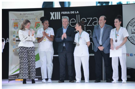
El director general de FP en el momento de entregar las medallas a las alumnas de Estética.

La competición de las modalidades de Peluquería y Estética ha tenido lugar el pasado día 31 de enero, coincidiendo con la celebración de la XIII Feria de la Belleza, Moda y Cosmética en la Institución Ferial de Badajoz (IFEBA)