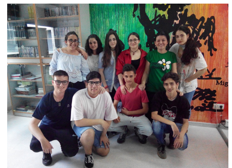
Los alumnos posan delante de unos de los murales que han pintado.

Área de Lengua Extranjera - Francés: Antoine de Saint-Exupéry, Hergé (cultura belga), Juana de