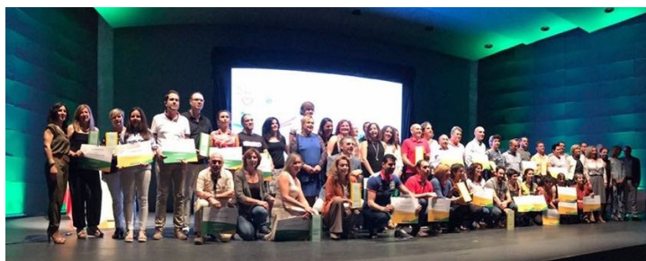
Los docentes premiados posan junto a la consejera de Educación y otras autoridades asistentes.