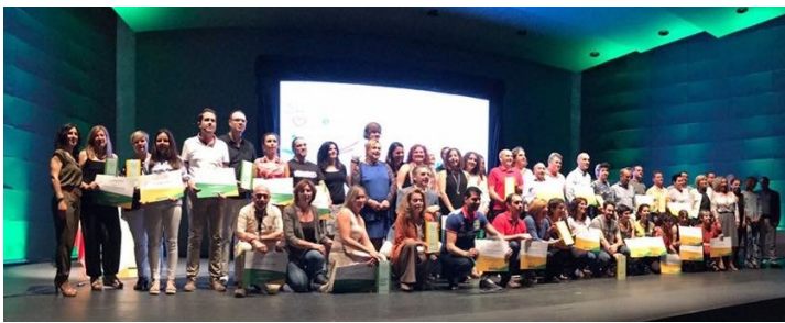
Los docentes premiados posan junto a la consejera de Educación y otras autoridades asistentes.