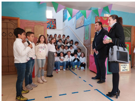
Un grupo de escolares recibe al secretario general de Educación recitiándole una poesía sobre Plasencia.