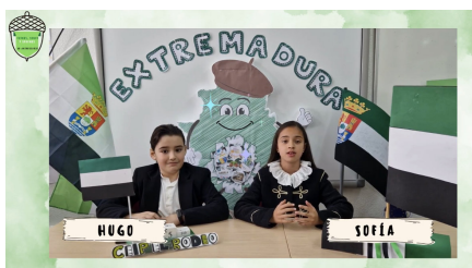
Informativo 'Fuimos, somos y seremos. Extremadura noticias', del CEIP El Rodeo.

Los grupos de alumnos y alumnas del CEIP El Rodeo , de Jerez de los Caballeros; del IES Muñoz Torrero , de Cabeza del Buey; del IES Valle del Jerte , de Plasencia, y del Conservatorio Profesional de Danza de Cáceres han sido los ganadores del Concurso 'Fuimos, somos y seremos: 40 Aniversario del Estatuto de Autonomía' , convocado por la Consejería de Educación y Empleo para animar a la comunidad educativa a conocer la evolución de la educación en estos 40 años.