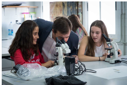
El presidente mira por el microscopio en una clase ante la atenta mirada de dos alumnas.