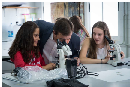
El presidente mira por el microscopio en una clase ante la atenta mirada de dos alumnas.