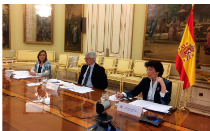
La ministra Celaá, (Dcha.) presidiendo la Conferencia Sectorial.

El Ministerio de Educación y Formación Profesional y el Ministerio de Universidades han acordado hoy, junto con las Comunidades Autónomas, que la prueba de Evaluación de Bachillerato para el Acceso a la Universidad (EBAU) se celebre entre el 22 de junio y el 10 de julio en convocatoria ordinaria y antes del 10 de septiembre en convocatoria extraordinaria