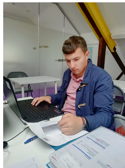
Otro de los alumnos trabajando en su empresa de prácticas.