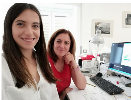
Una de las alumnas junto a su tutora durante las prácticas.

Dos alumnos del Ciclo Superior de Administración y Finanzas (AF) y otros cuatro de Grado Medio de Gestión Administrativa (GA) del IES Puente Ajuda, de Olivenza , han participado durante este curso en los proyectos Erasmus + y están realizando prácticas profesionales en empresas europeas. Este ya es el quinto año que este centro educativo desarrolla proyectos dentro de este programa europeo