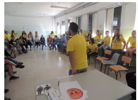
Organización de comida de refugiados.

En el de 'Sensibilización entre iguales' participaron 40 alumnos de 1º de Bachillerato del IES 'El Brocense', de Cáceres; y otros 60 participantes de 1º y 2º de ESO del IES 'Al-Qázeres', en el de