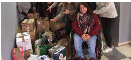
El equipo de alumnos con efectos para los refugiados.