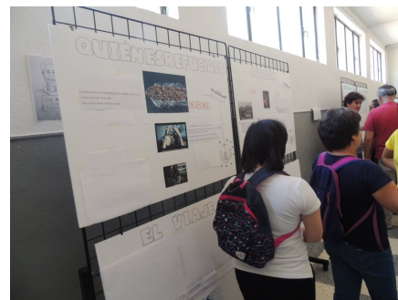
Exposición sobre los refugiados.

El premio que nos han concedido es un gran honor. Es el Premio Nacional Vicente Ferrer de Educación para el Desarrollo . Premia buenas prácticas educativas, lo que es muy importante para un docente, el reconocimiento a tu labor profesional. Consiste en la entrega de un diploma, en Madrid, en la sede de la AECID el 20 de octubre, y la asistencia de dos de las profesoras implicadas a unas jornadas de intercambio de buenas prácticas en Senegal , entre el 21 y 28 de octubre, además de la visita a diferentes proyectos de cooperación de la AECID en ese país. Es una oportunidad estupenda y muy estimulante y esperamos que nuestra experiencia nos sirva para evolucionar y ser mejores docentes y mejores personas.