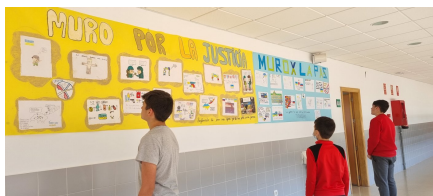
Mural instalado en el hall del centro.

Desde el inicio de la invasión de Rusia a Ucrania el IESO Vicente Ferrer, de La Parra, ha venido organizando diferentes actividades interdisciplinarias para promover la solidaridad con el pueblo ucraniano, reclamar la paz y concienciar a los estudiantes de que los conflictos no se solucionan con armas. Y, la más significativa ha sido la recaudación de 2.000 euros